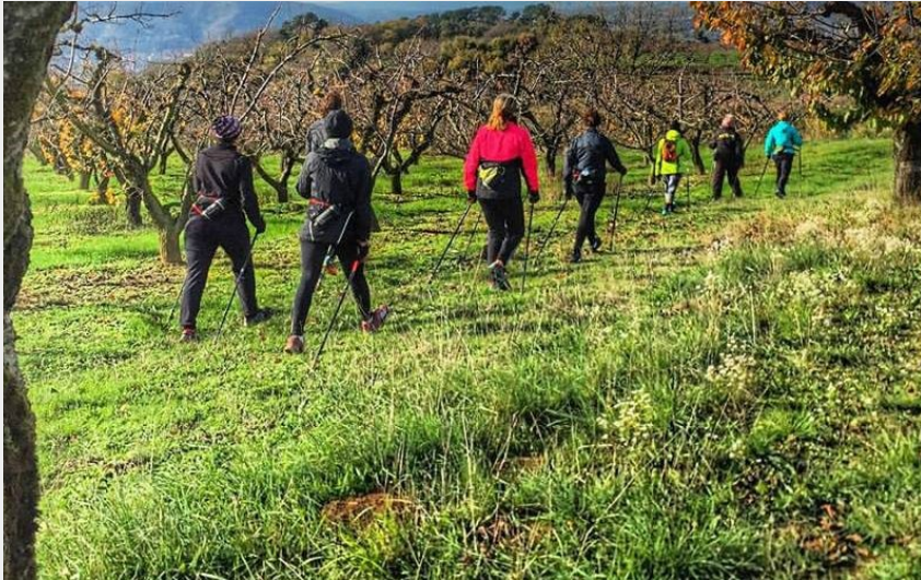
Randonnée hivernale (arche-agglo-admin)