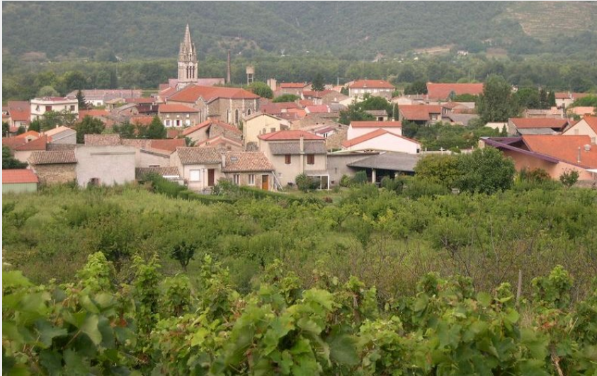
Village d'Erôme (Ardèche Hermitage Tourisme)