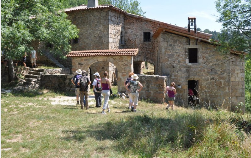
Chapelle de Saint Sorny