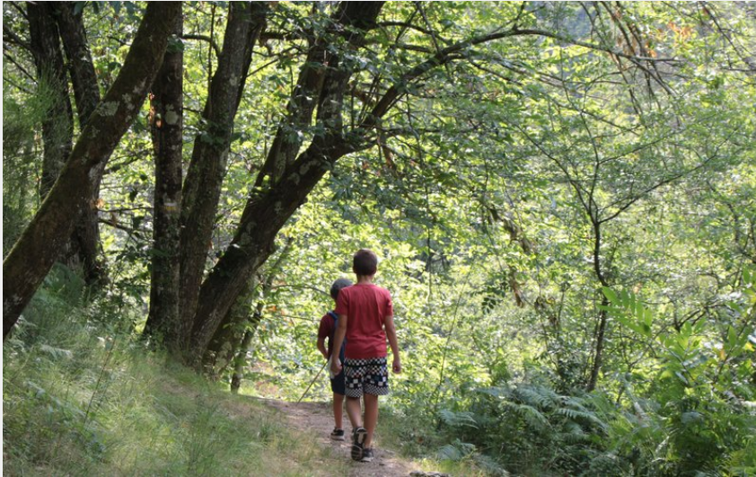
Abords de la Daronne